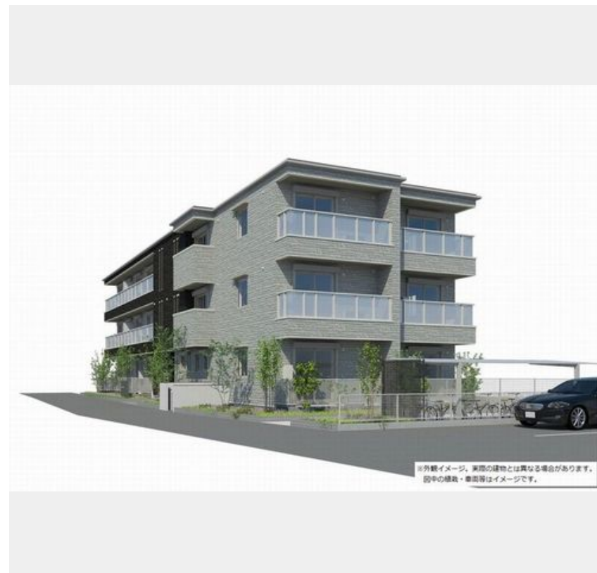
※外観イメージ。実際の建物とは異なる場合があります。図中の緑色・黄色等はイメージです。