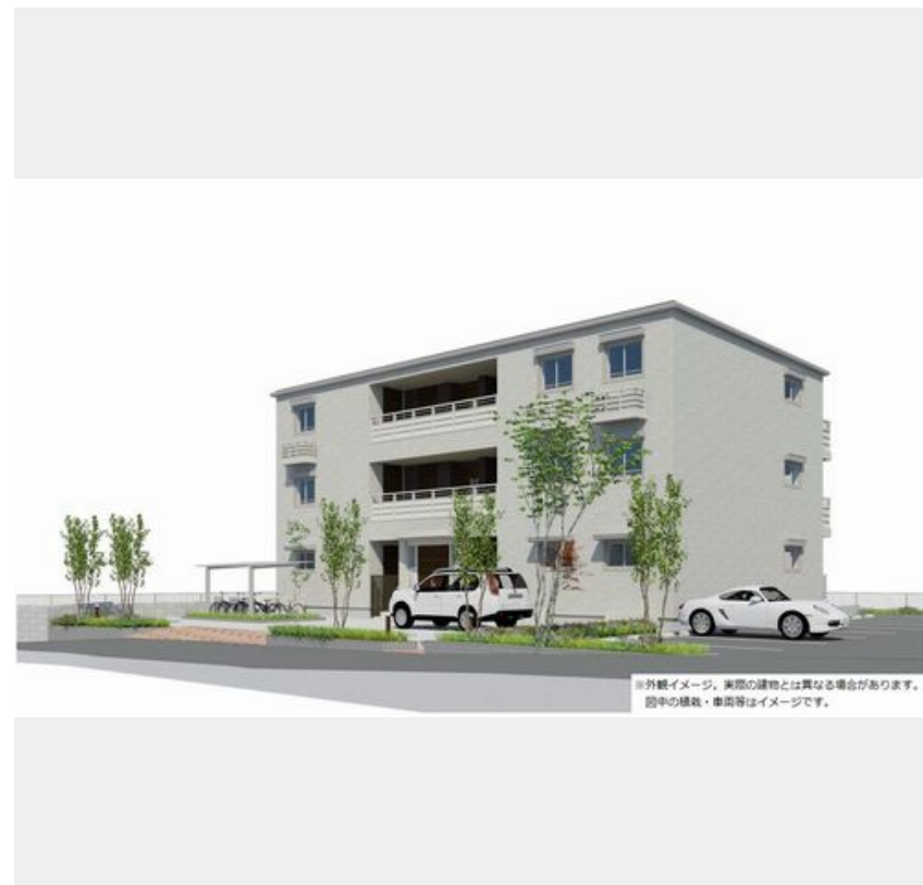
※外観イメージ。実際の建物とは異なる場合があります。図中の植栽・車庫等はイメージです。