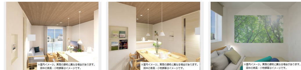
※室内イメージ。実際の建物と異なる場合があります。図中の家具・小物等はイメージです。