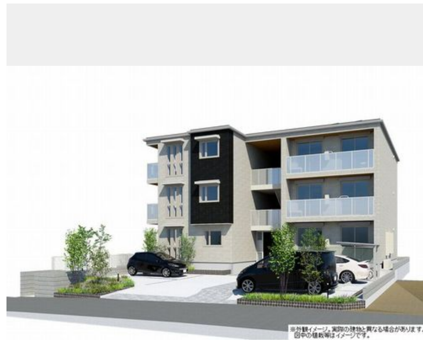
※外観イメージ。実際の建物と異なる場合があります。図中の植栽等はイメージです。