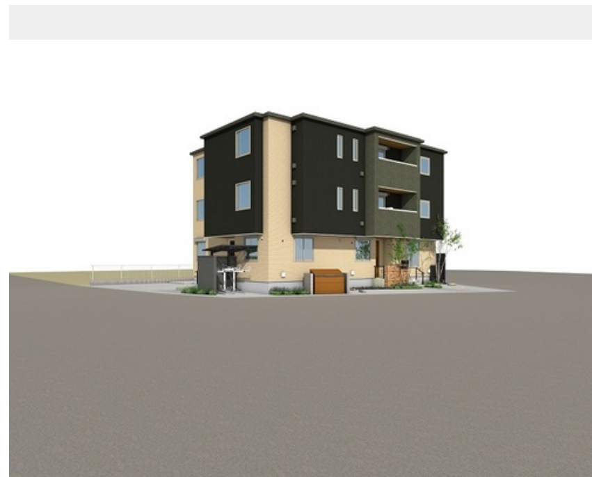
外観イメージです。実際の完成現場とは配色、仕様等変更になる場合がございます。