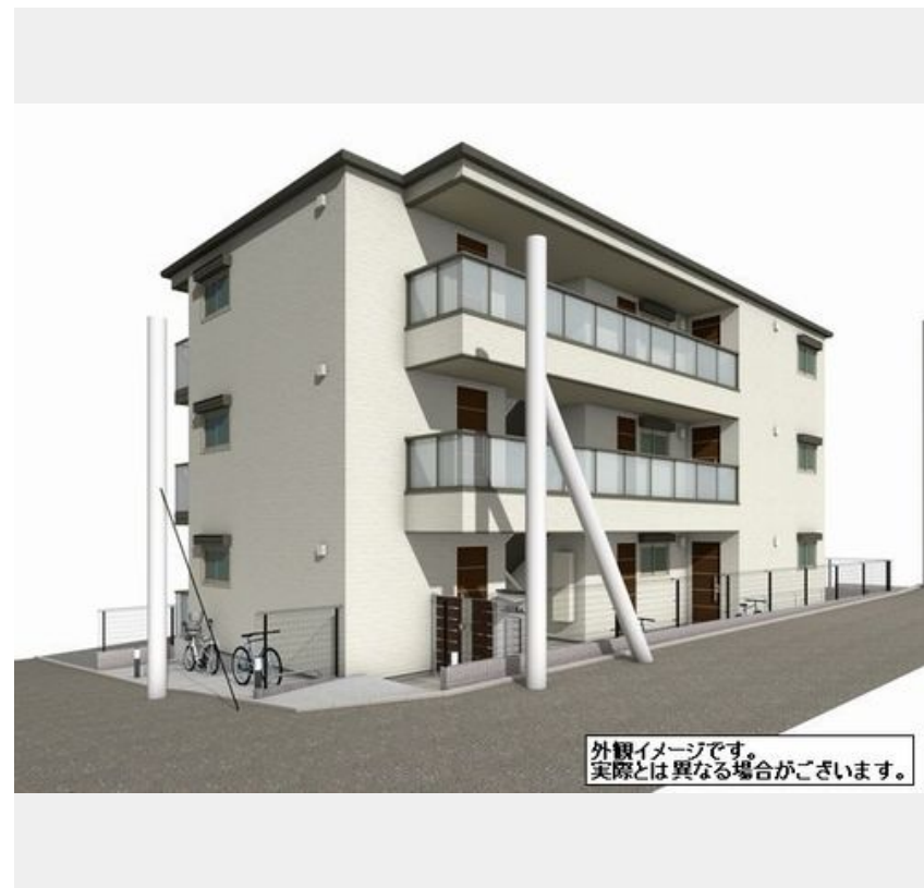
外観イメージです。実際とは異なる場合がございます。