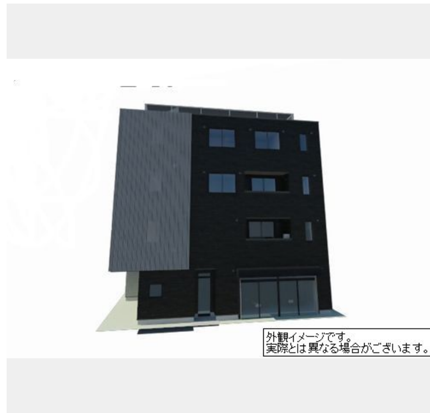
外観イメージです。実際とは異なる場合がございます。