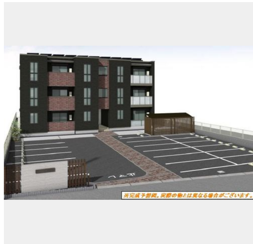
※完成予想図。実際の物とは異なる場合がございます。