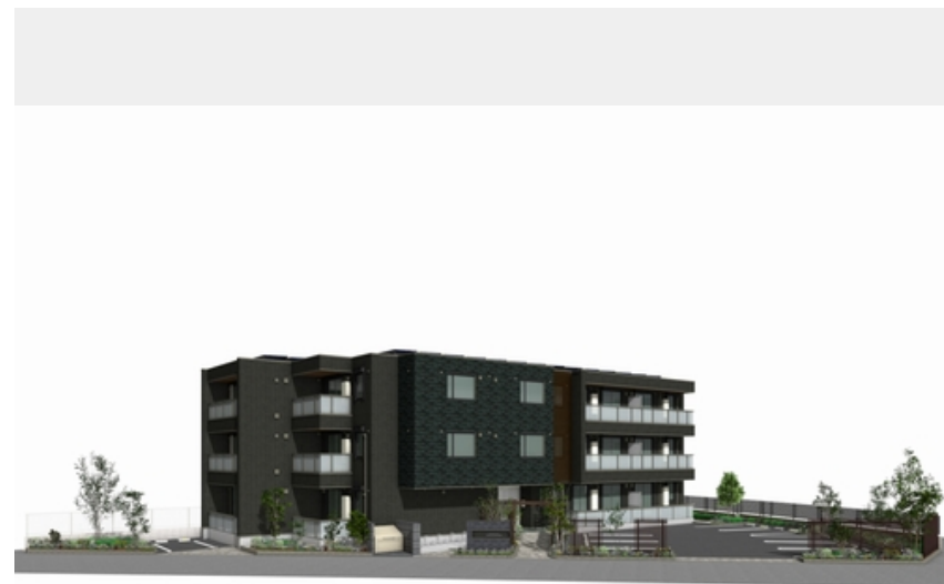
※イメージになります。実際とは異なる場合がございます。