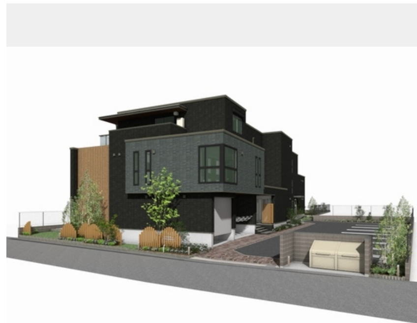
※イメージになります。実際とは異なる場合がございます。