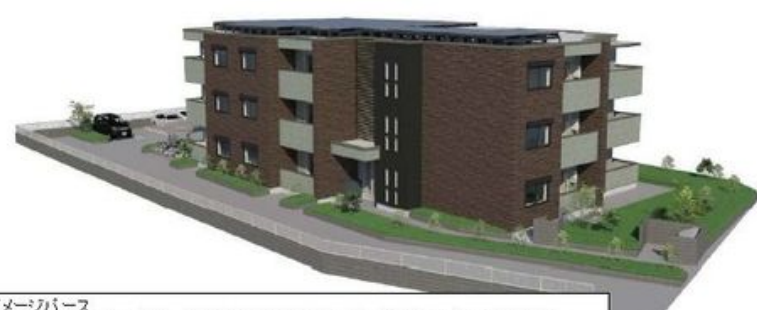
イメージパース このイメージ図・イラストは、計画段階の図面を基に施工業者が作成したものです。 設計施工上の理由などにより変更となる場合があります。変更の場合は現状有姿とします。