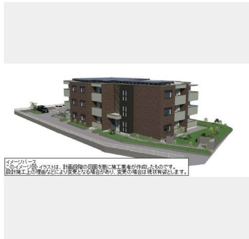
イメージパース このイメージパース・イラストは、計画段階の図面を基に施工業者が作成したものです。 設計施工上の理由などにより変更となる場合があります。変更の場合は現状有姿とします。