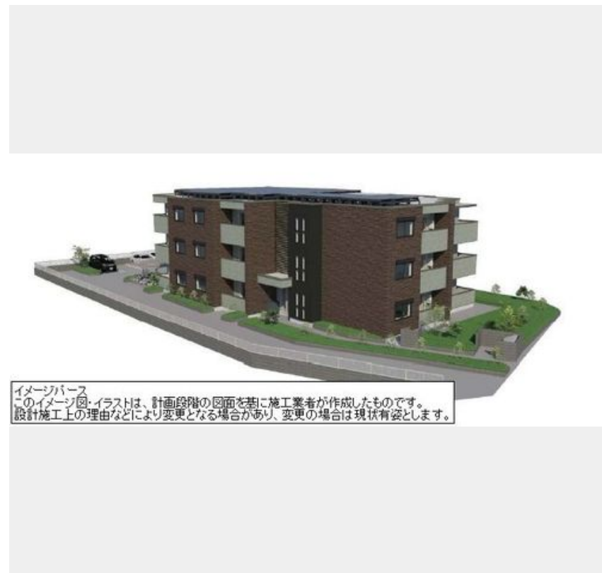
イメージパース このイメージ・イラストは、計画段階の図面を基に施工業者が作成したものです。 設計施工上の理由などにより変更となる場合があります。変更の場合は現状有姿とします。